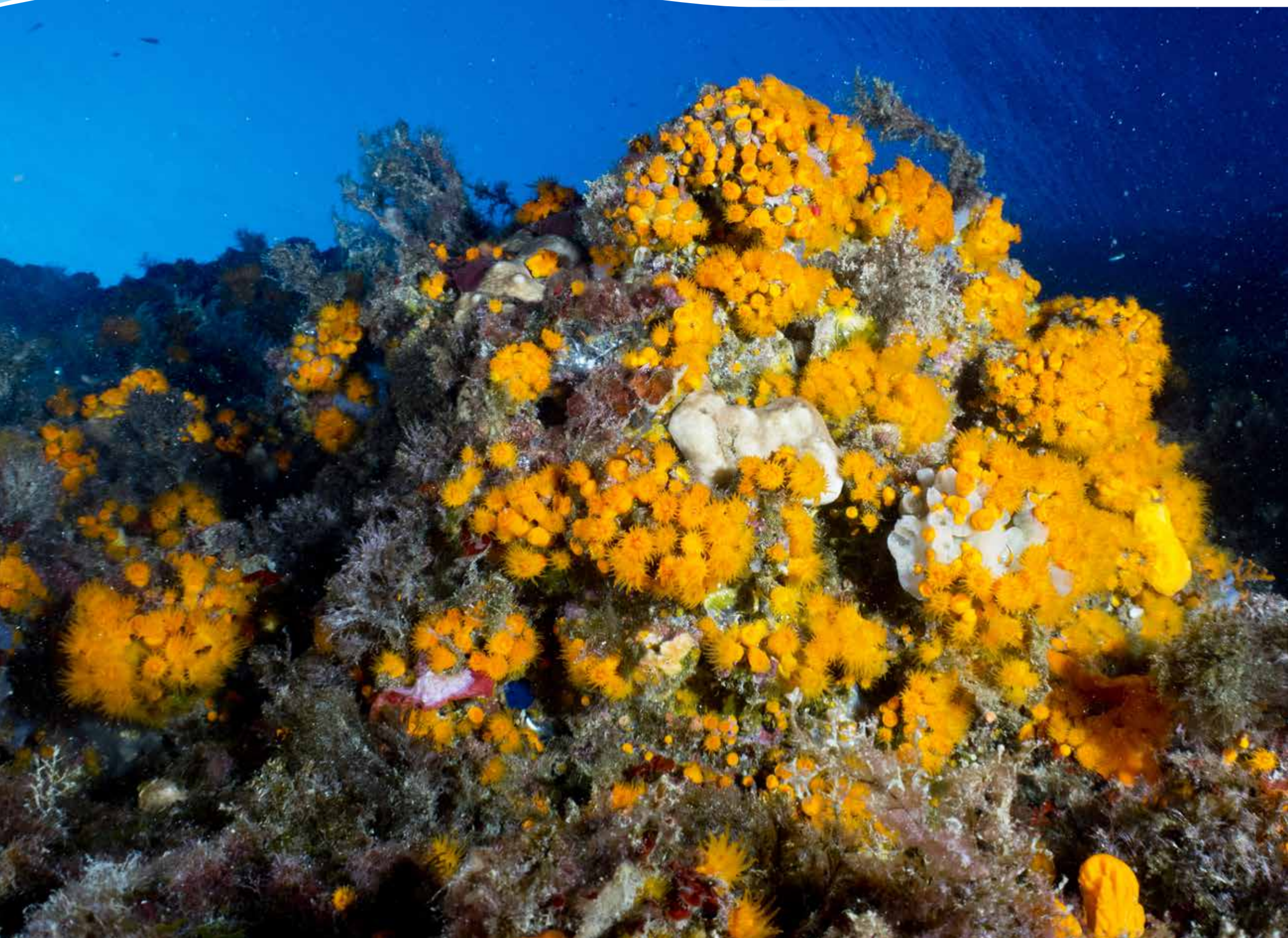
Madrepore arancioni