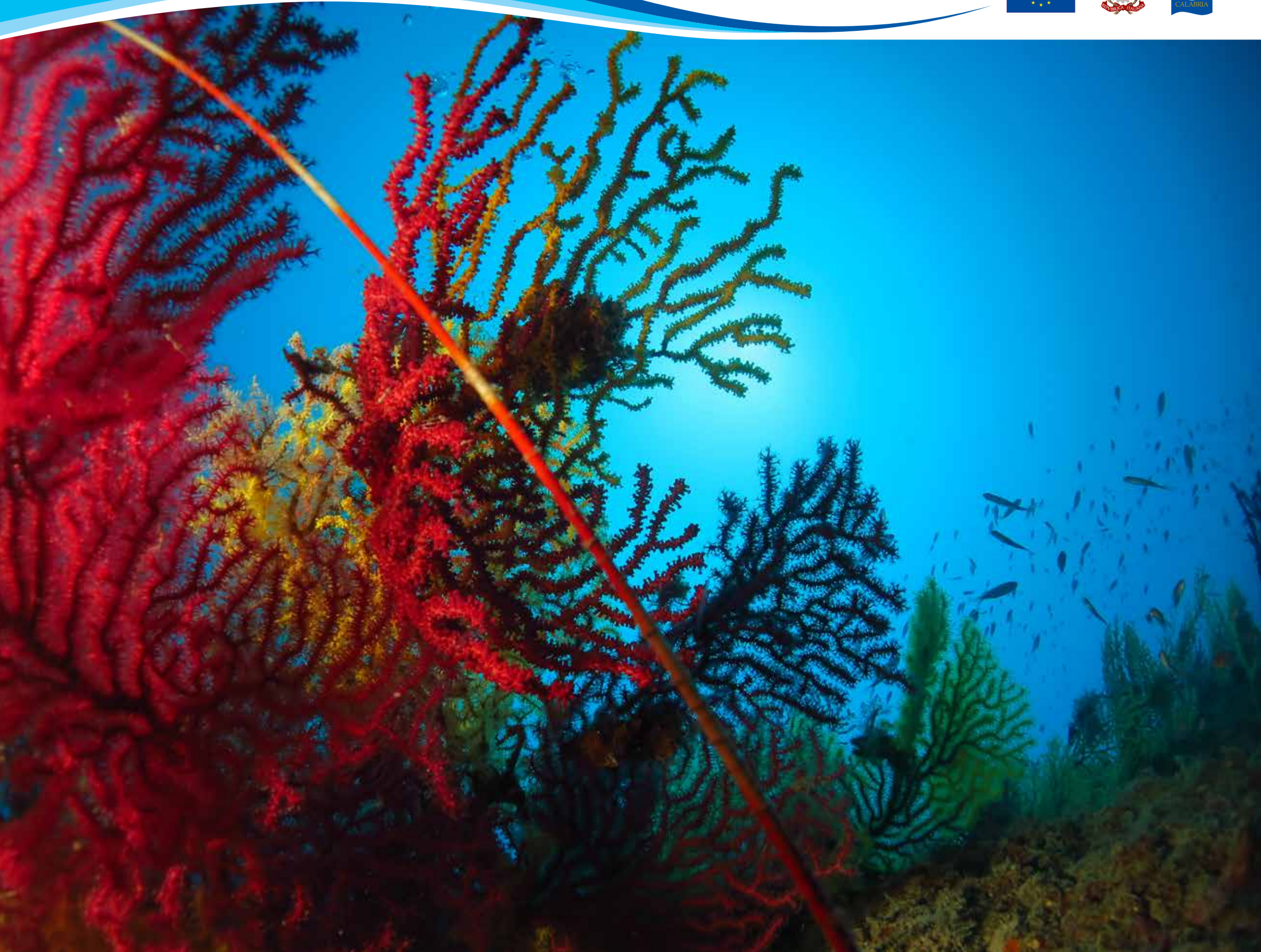
Ventagli di Gorgonia