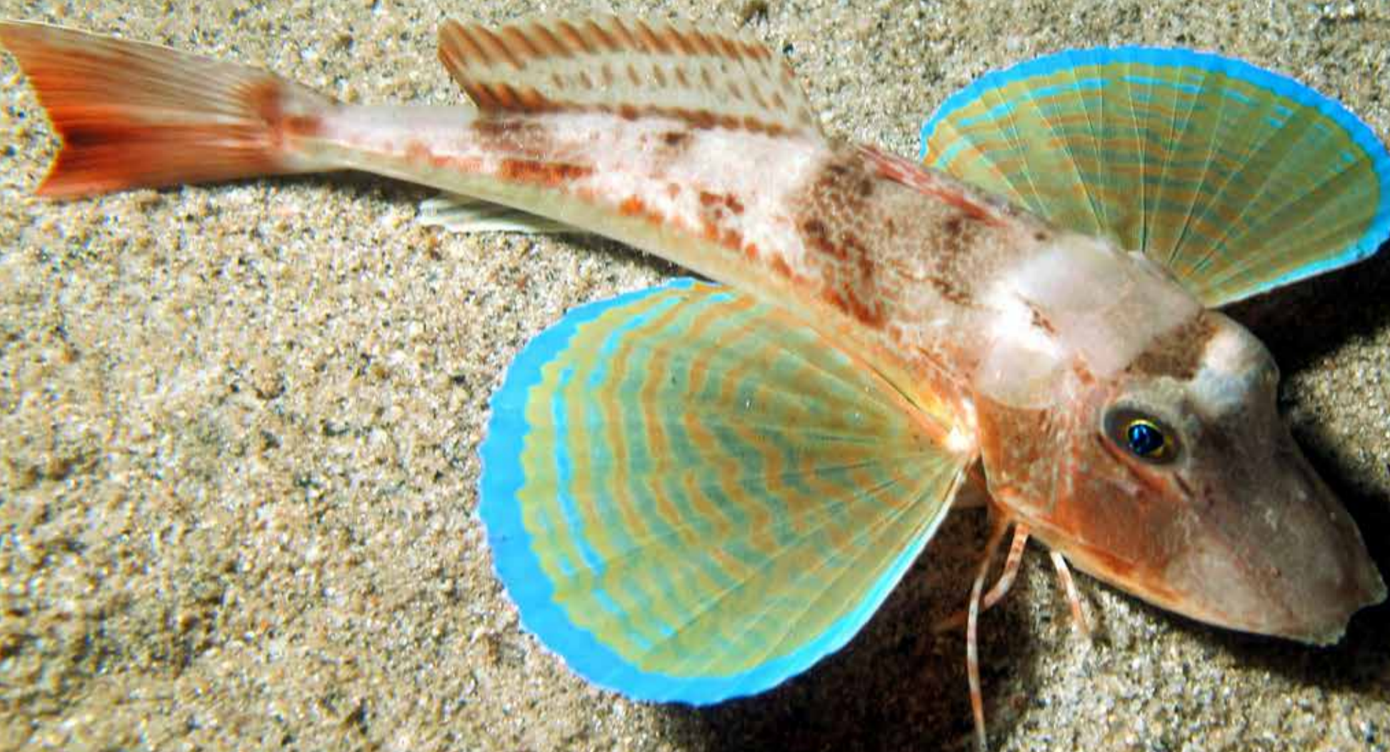
Capone gallinella ( Chelidonichthys Lucerna )