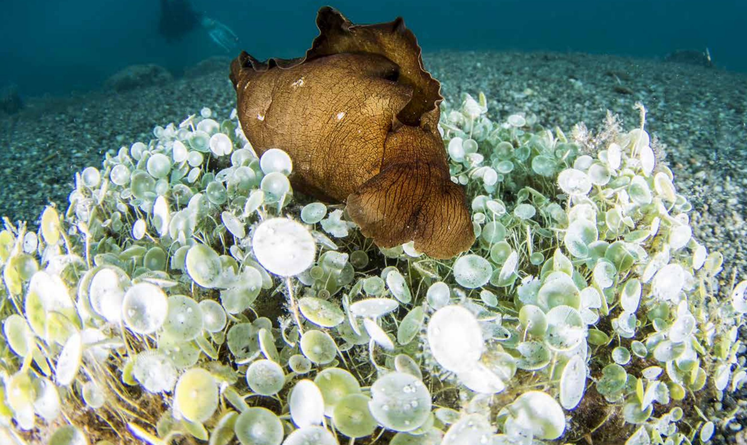
Aplysia depilans su prato di Acetabularia