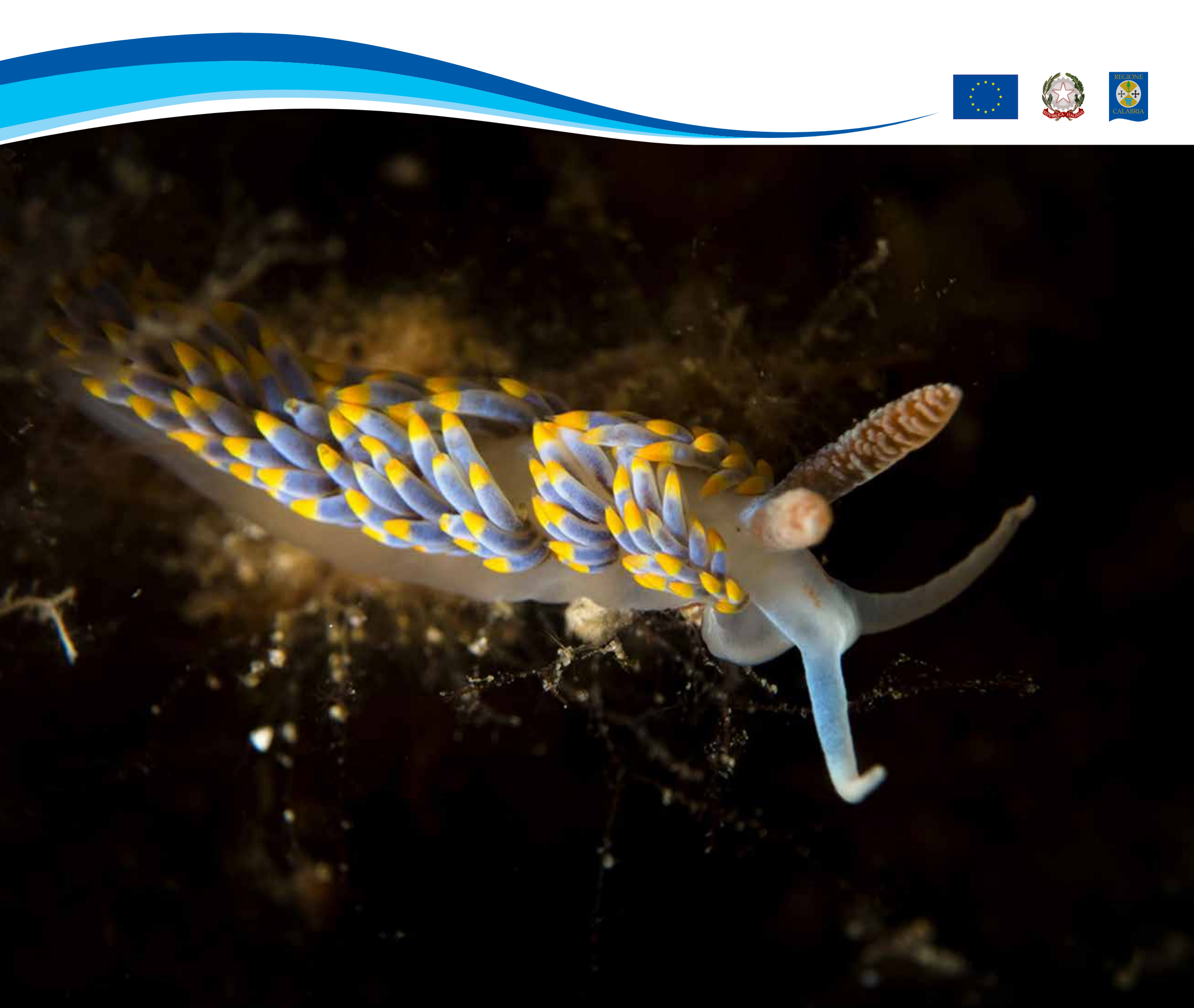
Nudibranchio Berghia Coerulescens