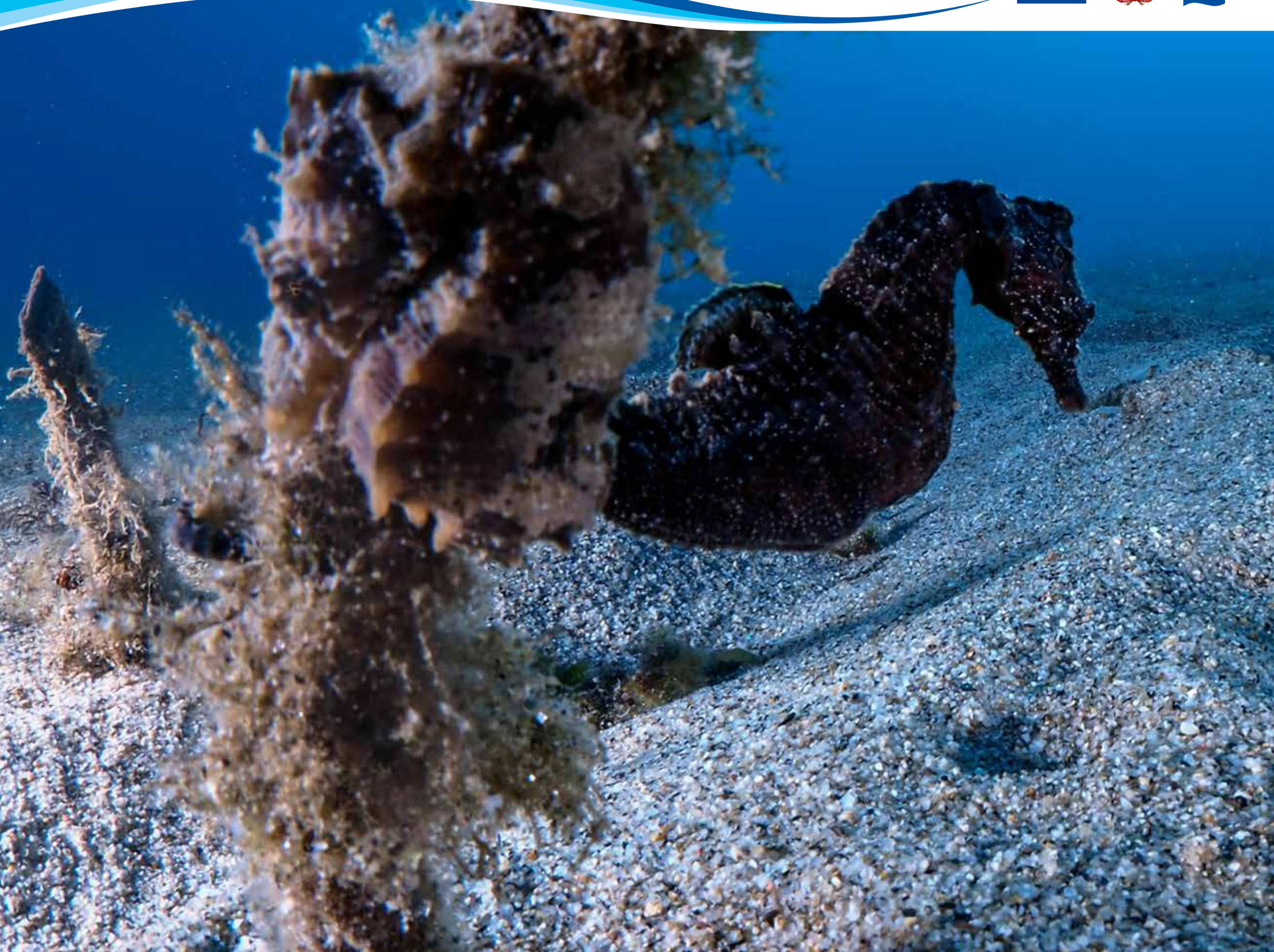
Cavalluccio marino ( Hippocampus )