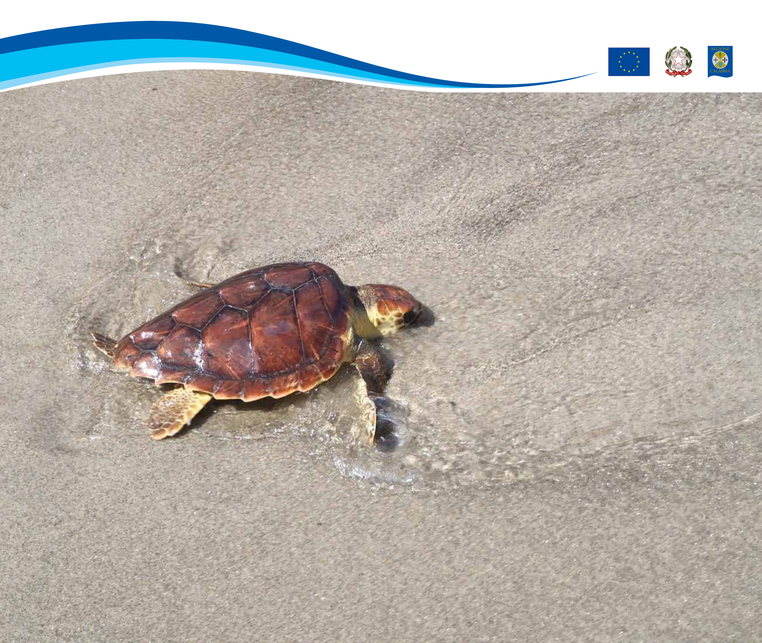
Tartaruga marina Caretta caretta