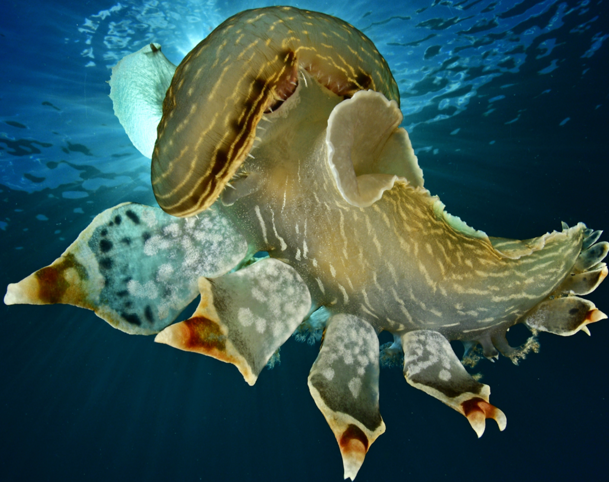
Nudibranchio Tethys fimbria