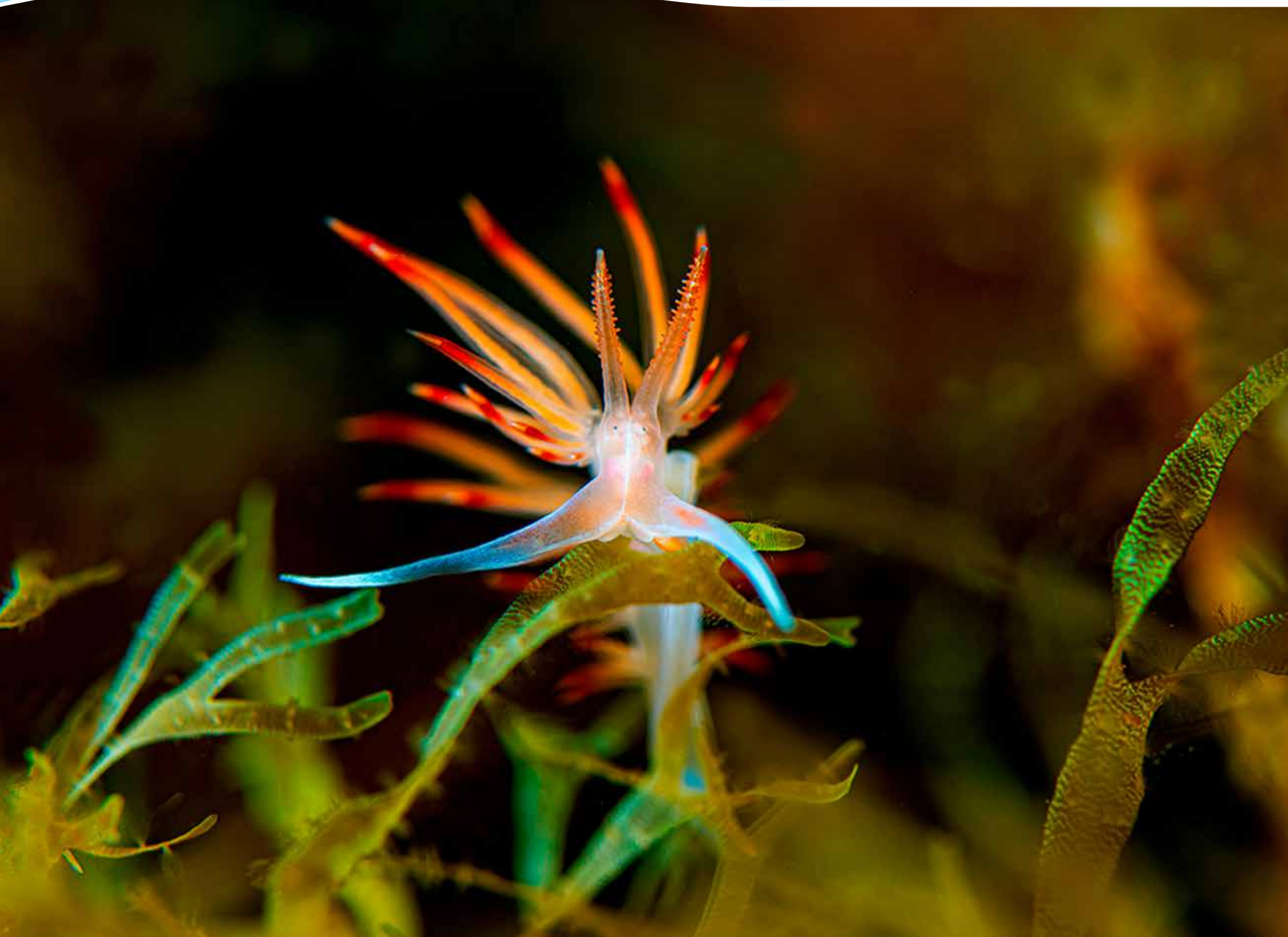
Nudibranchio Flabelina - PH Mauro Finotti