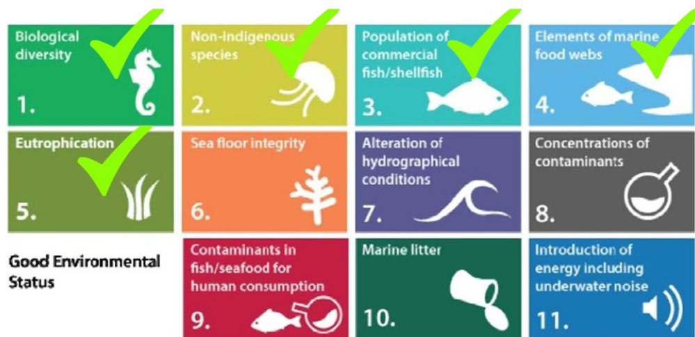
Figura 2. Indicatori del Modulo 10 Praterie di P. oceanica su cui avranno impatto positivo le attività del progetto.

Il progetto EDIPO creerà una rete di collaborazione e di scambio reciproco tra istituti di ricerca, Ente Parchi Marini e numerose agenzie territoriali quali comuni, provincie, capitanerie di porto, associazioni, FLAG, Dipartimenti Regionali che insieme concorreranno al consolidamento delle buone pratiche e a garantire una compagine di riferimento per progettualità future nell'ambito del monitoraggio, conservazione e ripristino delle Aree Marine Protette e delle ZCS.